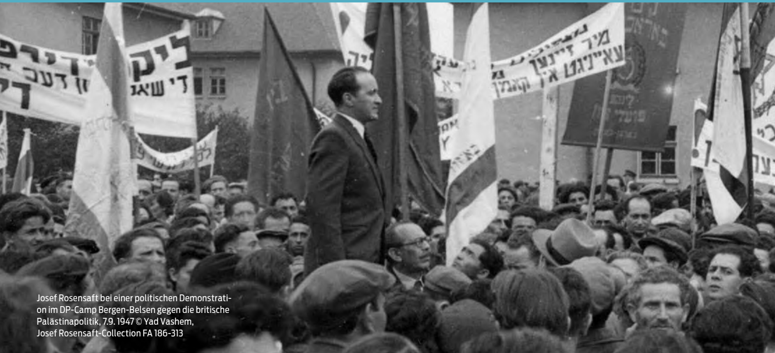
Josef Rosensaft bei einer politischen Demonstration im DP-Camp Bergen-Belsen gegen die britische Palästinapolitik, 7.9.1947