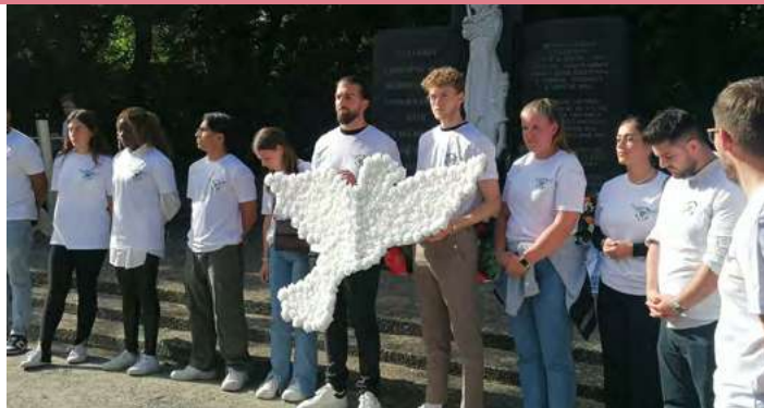
IG Metall Jugend

80 Jahre nach Kriegsende werden neben Grußworten besonders die Ideen und Reflexionen der IG Metall Jugend im Fokus stehen: Die IG Metall trägt seit Jahren eine besondere Verantwortung für die Anlage des Ehrenfriedhofs. Durch die engagierten und innovativen Beiträge wird die Auseinandersetzung mit der Geschichte des Ortes, aber auch mit aktuellen Konflikten, immer weiter angeregt.