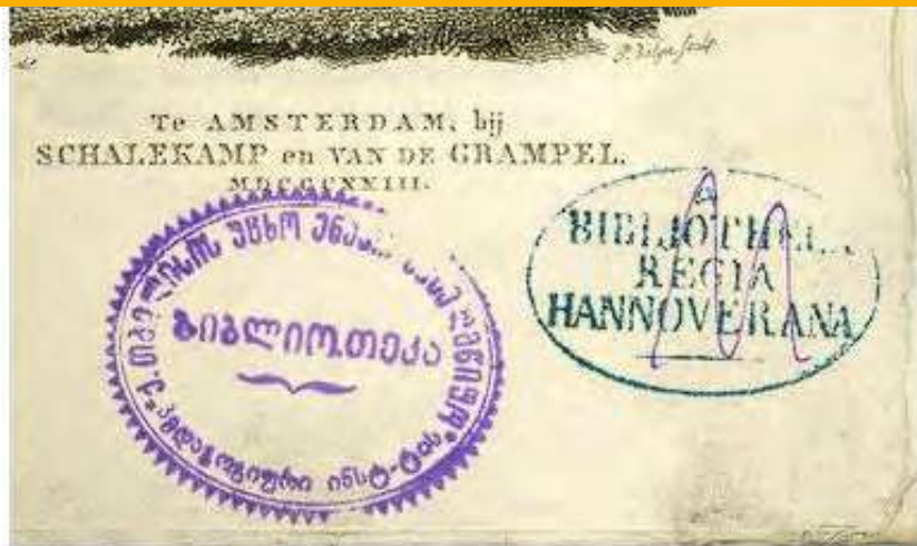
Georgischer Besitzstempel in einem Buch aus dem Bestand der Bibliothek