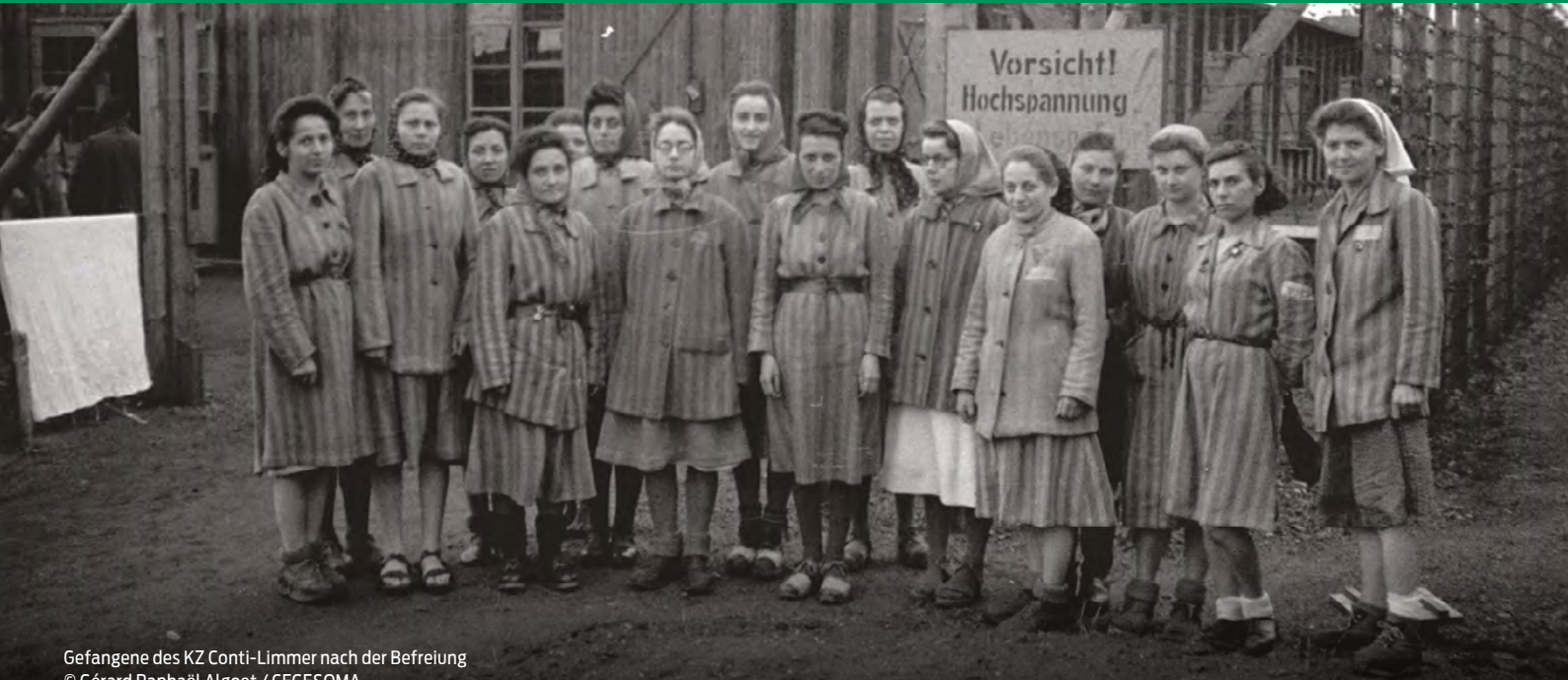
Gefangene des KZ Conti-Limmer nach der Befreiung