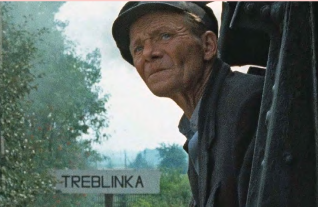
Screenshot aus Lanzmanns „Shoah“